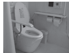
車いす用トイレに改造