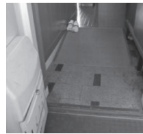
玄関とベランダにスロープ設置