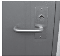
ドアノブをレバー型に