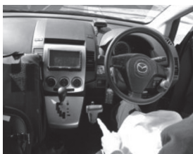
上肢駆動装置に改造

2007年3月に自宅復帰後も、職業能力開発へ車で通所したり、絵てがみサークルや障害者スポーツの講座に参加しました。通勤・職場環境も整い、同年11月、職場へ復帰!