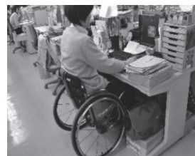
車いすがすっぽり!