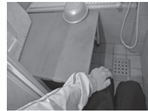
浴室に洗体台を設置 扉は引き戸に変更